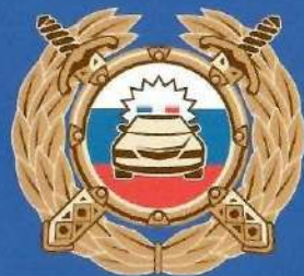
Госавтоинспекция МВД России

Буклет изготовлен по заказу Минпросвещения России в рамках реализации федеральной целевой программы «Повышение безопасности дорожного движения в 2013–2020 годах».