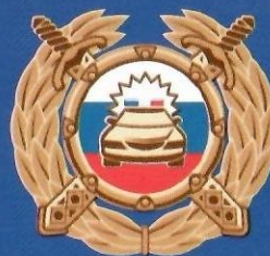
Госавтоинспекция МВД России

Буклет изготовлен по заказу Минпросвещения России в рамках реализации федеральной целевой программы «Повышение безопасности дорожного движения в 2013–2020 годах».